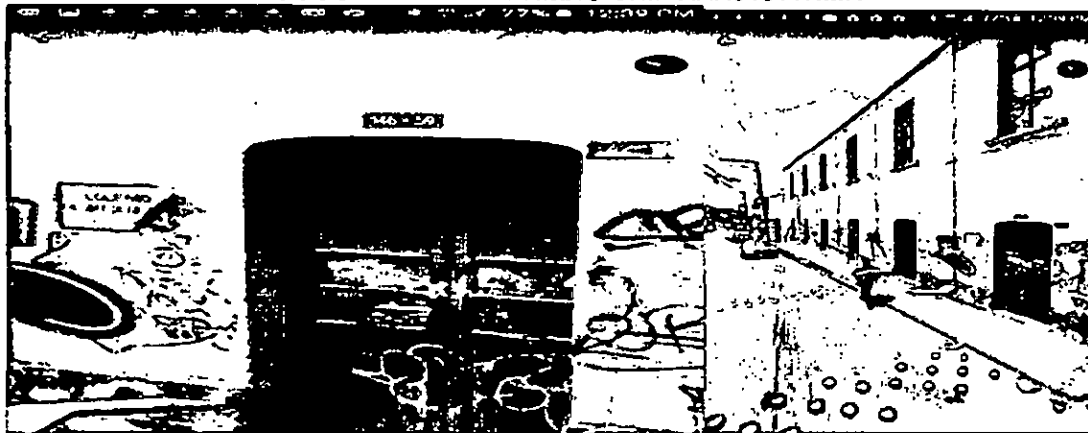
IMAGEN 5 GOOGLE EARTH – PREDIO CHIP AAA0131TNMR

El predio presenta estado activo con un avalúo catastral para la vigencia de 2015 de $476.760.000.