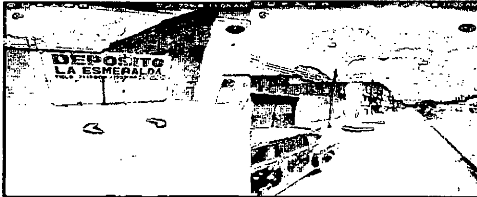
IMAGEN 3 IMAGEN GOOGLE EARTH CHIP AAA0131TNMR

"Por un control fiscal efectivo y transparente"